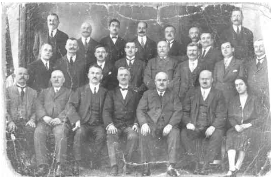
4. kép: A sárvári ipartestület elnöksége