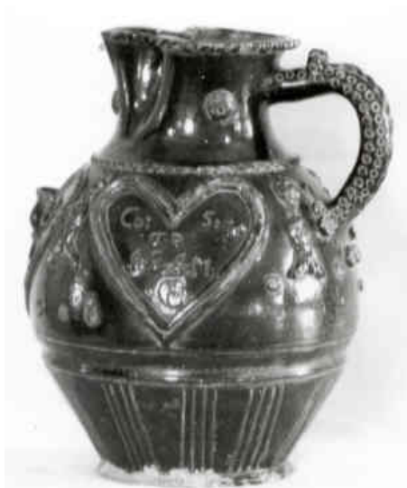
1. kép: A sárvári fazekas céh korsója, 1799.